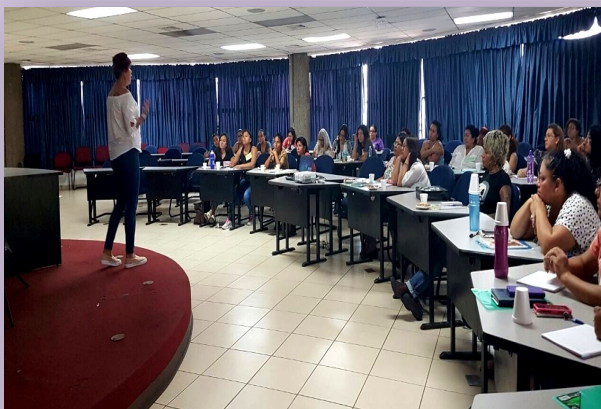
Talleres de la Escuela de Debate Feminista

Actividad financiada por Gobierno de Navarra a través de Setem Navarra y ejecutado por Mujeres Transformando.