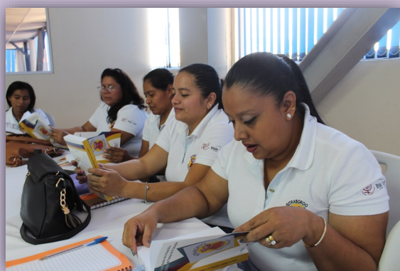
Mujeres leyendo el Código de Trabajo