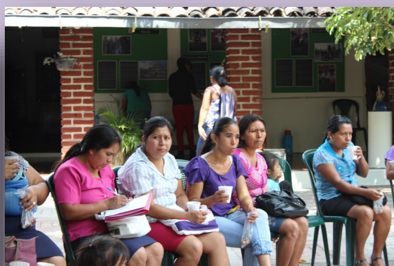
Taller del color impartido a las mujeres de la Iniciativa económica “Creaciones y bordados de Panchimalco”