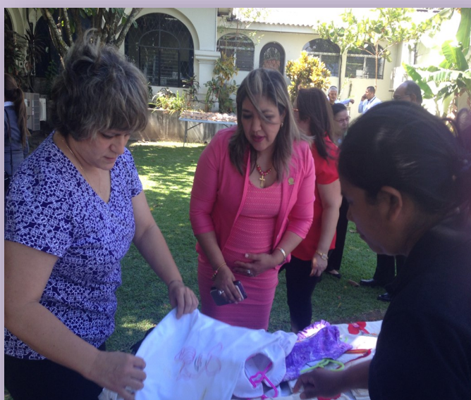
Actividad en el CNJ

En diferentes actividades o ferias las mujeres que integran la iniciativa económica “ Creaciones y bordados Panchimalco ” distribuyen sus productos.