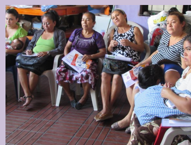
Talleres con mujeres trabajadoras del sector textil de la zona central del país y jornadas con mujeres trabajadoras por cuenta propia. Financiado por la Agencia Vasca de Cooperación al Desarrollo a través de Setem Euskadi