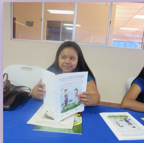
Talleres de la red de Cuidadoras de la Salud Integral

Algunos de los temas desarrollados fueron: Mi cuerpo: con el objetivo de identificar que guardamos el recuerdo de las bur-las y desprecios recibidos sobre nuestro cuerpo y que esto nos impide sentirnos bien y reflexionar como nos afecta en relación al cuidado de nuestra salud y la importancia de autocuidarnos. También se trabajo en el plan de estratégico de la red de cuidadoras de la Salud Integral 2017. Actividad financiada por Brücke Le Pont