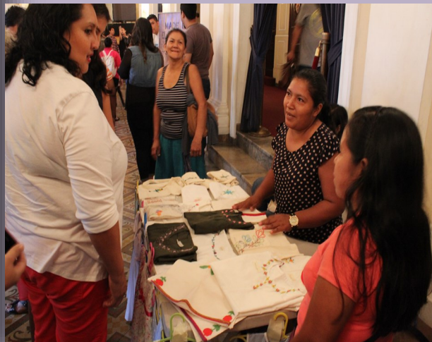
Actividad en el Teatro Nacional