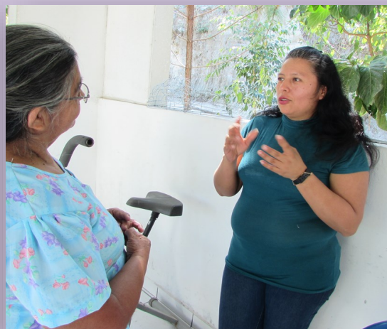
Jornadas de derechos laborales, fortalecimiento personal y salud sexual y reproductiva son impartidos a las bordadoras a domicilio. Financiado por Brücke Le Pont