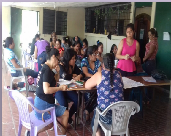
Talleres impartido a mujeres trabajadoras de maquila del Occidente del país. Jornadas financiadas por Agencia Vasca de Cooperación al Desarrollo a través de Setem Euskadi