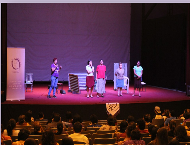
Presentación de "Made in El Salvador" realizada en conjunto con la Unidad de Género de la Universidad de El Salvador, en el marco del Día Internacional de la mujer

Ese mismo día, se coordinó con la Unidad de Género de la Universidad de El Salvador la presentación de la obra de teatro "Made in El Salvador y de bordar en bordar se me fue la vida". Dicha presentación permite la reflexión y sensibilización de las mujeres que laboran en el sector textil y así mismo la identificación de diferentes violencias hacia la mujer.