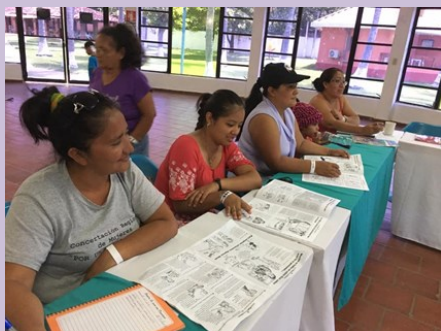
CMTM trabajando en equipo