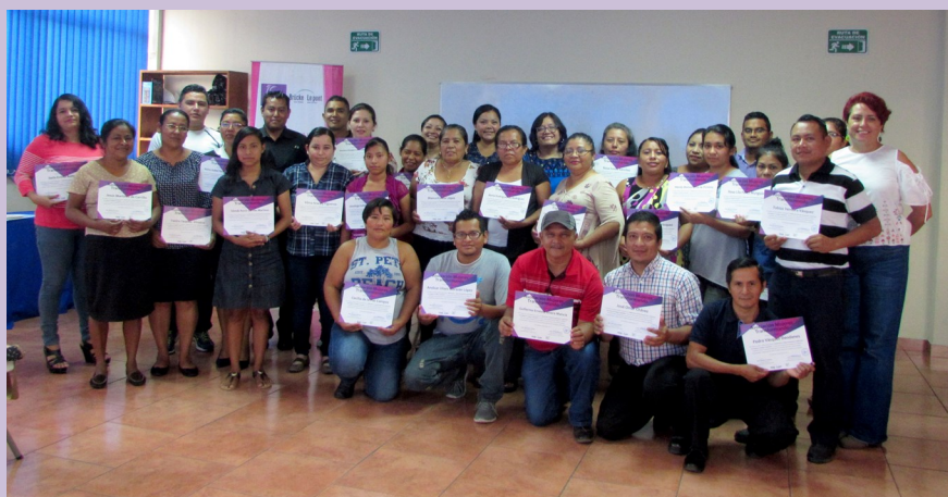
Clausura Diplomado en Salud Ocupacional y Ergonomía con Énfasis en Trabajo a Domicilio