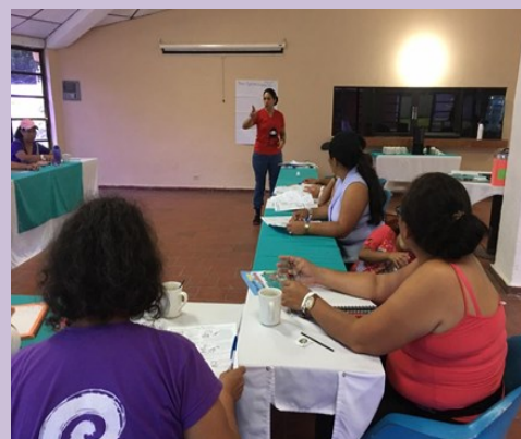
Exposición de propuestas de reformas a pensiones

d) a personas que prestan servicios profesionales y que no están formalizadas, para que coticen o sigan cotizando como trabajadoras por cuenta propia.