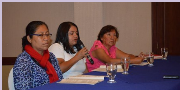
Foro: Posicionamiento de las Mujeres frente al actual contexto de Reforma al Sistema de Pensiones”.