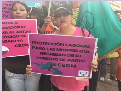
CEDM exigiendo la reforma al Art. 113 del Código de Trabajo

El pasado 6 de septiembre las diferentes organizaciones e Instituciones que integran el Comité Municipal de Paz y Convivencia (CMPC) y la Mesa de Género de Panchimalco en el marco de las fiestas patronales del municipio, realizaron diferentes actividades informativas para promover la convivencia en dicho municipio.