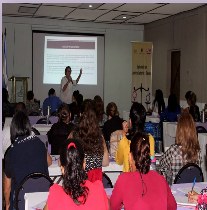
Jornada Sexo Género y acceso a la justicia