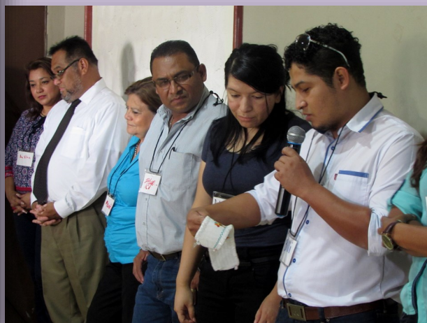
Jornada: Trabajo a domicilio