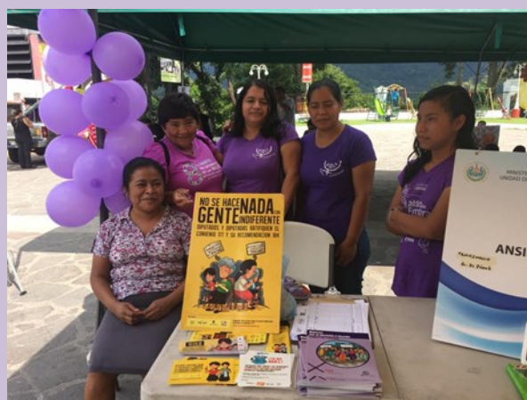
Bordadoras a domicilio en stand brindando información sobre la ratificación del Convenio 177 de la OIT