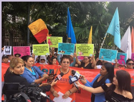
CEDM exigiendo la reforma al Art. 113 del Código de Trabajo

El pasado 7 de septiembre La Concertación por un Empleo Digno para las Mujeres (CEDM), realiza un plantón fuera de la Asamblea Legislativa para exigir estabilidad laboral para las mujeres, en esta actividad se les hizo un llamado a los Diputados y Diputadas para que reformen el artículo 113 del código de Trabajo